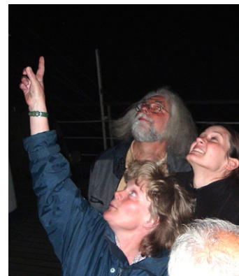
"Welcher Stern ist das?" - diese Frage hört man heutzutage oft.

All' dies sind Bestandteile eines beständigen kosmischen U(h)rwerks.