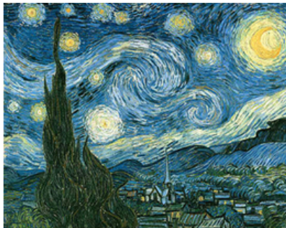
Der Himmel - von jeher auch Quell' der Inspiration

Spuren "astronomischer Mitwirkung" finden wir über die